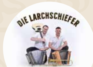
Die Larch- schiefer